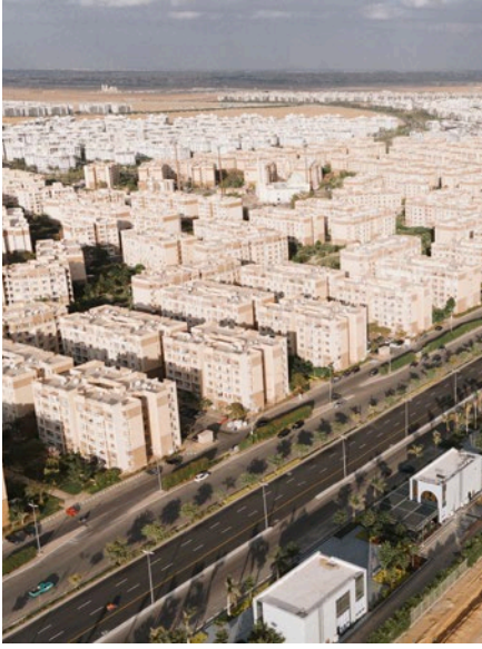
LA MIRADA MOSTAKBAL City